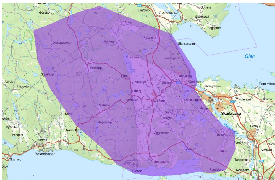
Figur 3. Karta över Vånga med omland.