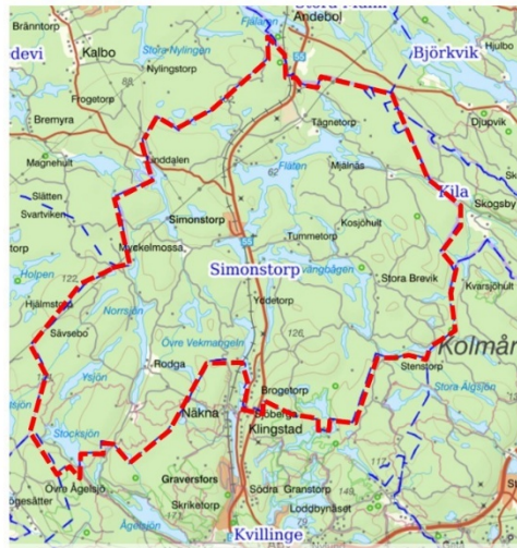
Figur 2. Karta över Simonstorp med omland